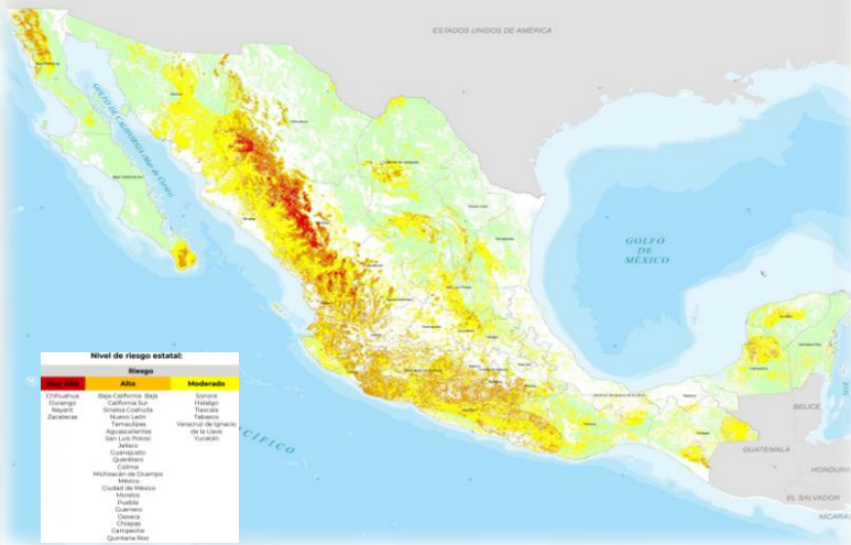
Mapa de riesgo del periodo julio-septiembre 2023.